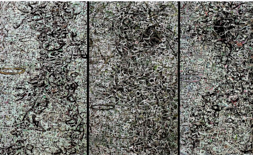
一个阴冷的上海早晨 三联画 184cm X 107cm 布上丙烯