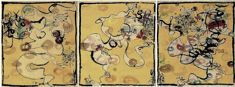
指间话语 45cm X 40cm

牛安画如其人，有一种女性所特有的、充满感性的优美。多重的教育和文化的背景，成就了她高品味的审美观。她少年时习书法，大学时攻西画，而后多年留学日本进修设计，又进一步在美国领悟西方艺术。东方与西方的养分，自然而然地融和于她的创作之中。而最为难得的是，知识与文化的重荷却丝毫没有淹没牛安作为一个艺术家的敏感天性。她的画，始终是激情的率真表现。她因感觉而画，随性随意而画，从未滞留在形式或观念的桎梏里。在她的创作里，没有重复和雷同。正如她自己所说的那样，“我画每一幅画，都是要表现当时的某种感觉。我在挥动画笔宣泄情绪的时候，感到快乐。如果我要去重复过去已经画过的东西，那是不可能的。因为当时的感觉和情绪已经过去了。”