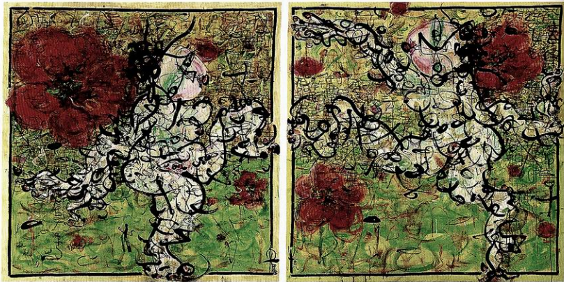
花开之际 142cm X142cm

散发着灵动的气韵。仅仅就凭着一根线，画家便可以变幻出无数的构图，将那些舞蹈着、扭动着、因载负着太多生命激情而不得安宁的躯体，姿态万千地——呈现在画面上。点缀在线条之间的淡雅色彩，以及画家随意而书的只言片语，更使画面显得丰富而别有一番优雅的中国韵味。