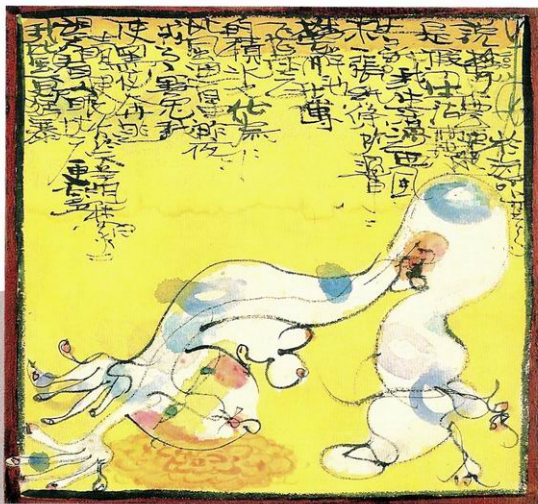
诗人和花 45cm X 40cm