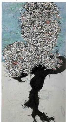
玩心主人 184cm X 85cm, 丙烯, 画布, 2003