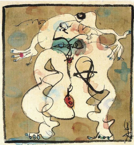
爱人 45cm X 40cm 水墨、纸、画布 2008